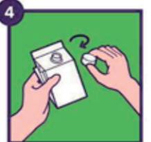
Heeft de verpakking een dop? Doe deze er weer op!

Als iets kapot is, niet direct weggooiën, maar ga ernaar naar een Repair café. Meestal is er nog veel te redden. Wel tegen een kleine vergoeding.