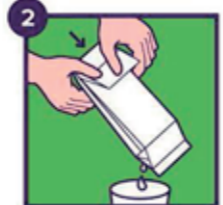
Duw het restje inhoud eruit