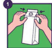
Vouw de zijkan- ten naar binnen

Het is handig om de ruimte in de container zo efficiënt mogelijk te gebruiken. Zo gooit u bijvoorbeeld een leeg (drank)karton in de oranje container: