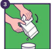
Vouw de verpakking dubbel