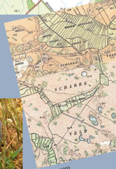
Situatie A° 1900