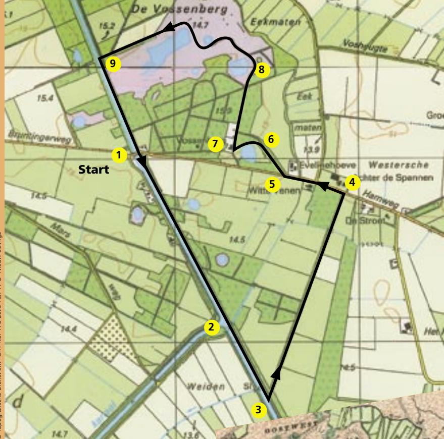
No. 17B Beilen en 17.D Nieuw Balinge

De Landmaatschappij Drenthe wist de Provincie Drenthe ervan te overtuigen dat het voor de economische