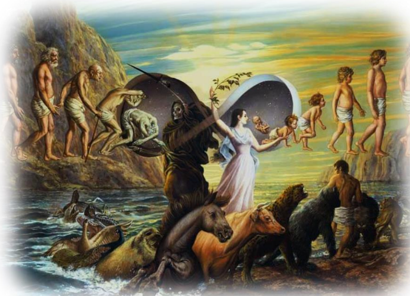
Levenscyclus in de Evolutie

Nou ja, ik ga maar weer eens aan de wandel, want ik wil die Grote Barmsijs toch wel graag even zien voordat hij naar het noorden vertrekt en misschien kom ik nog wel iets anders tegen. Of iemand, dat kan ook. Wie zal 't zeggen.